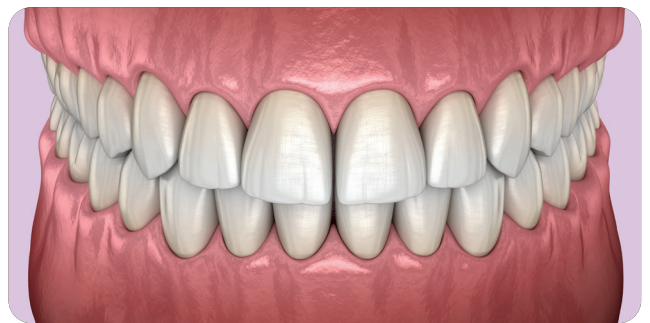
Dents soignées suite au détartrage.